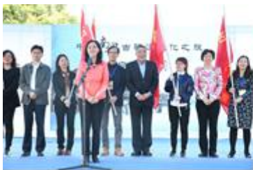
南粤古驿道文化之旅在云浮兰寨启动

结合南粤古驿道文化线路沿线的历史文化名镇、古镇及部分古驿道历史节点，建设融合文化、旅游、产业、生活等功能的南粤古驿道文化特色乡镇和特色村落