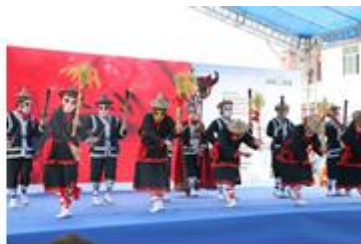
兰寨非物质文化遗产——禾楼舞